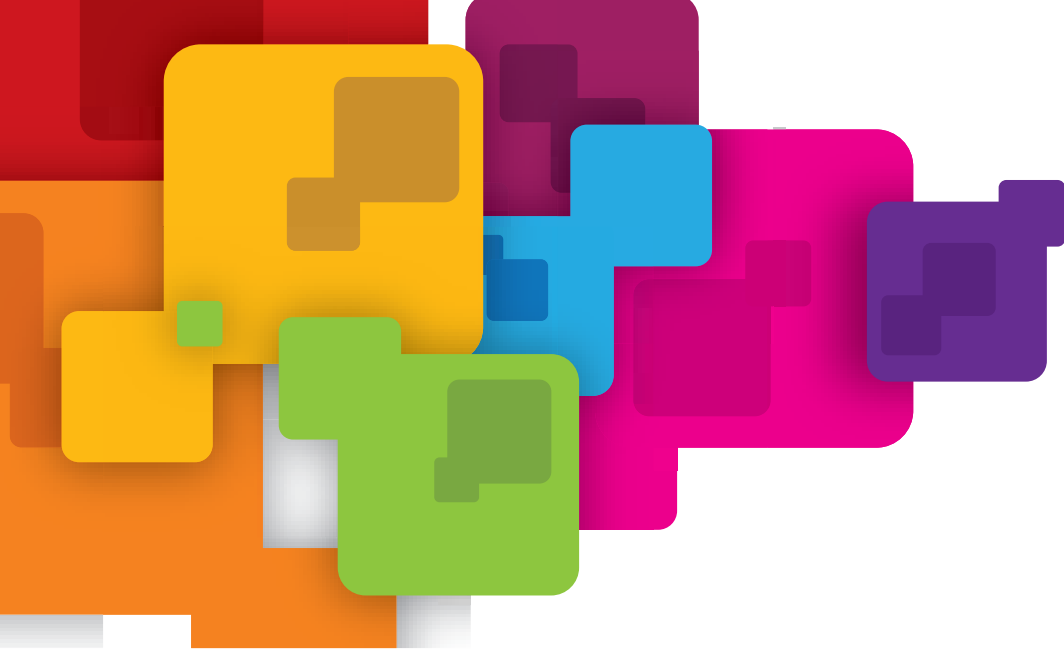
SGE – Instituto Reação - Itaquera