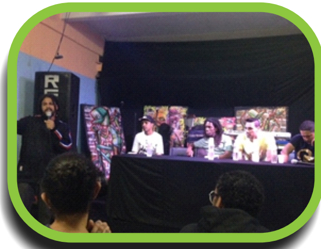
SGE – Audit. Hospital M'Boi Mirim – Jd Angela